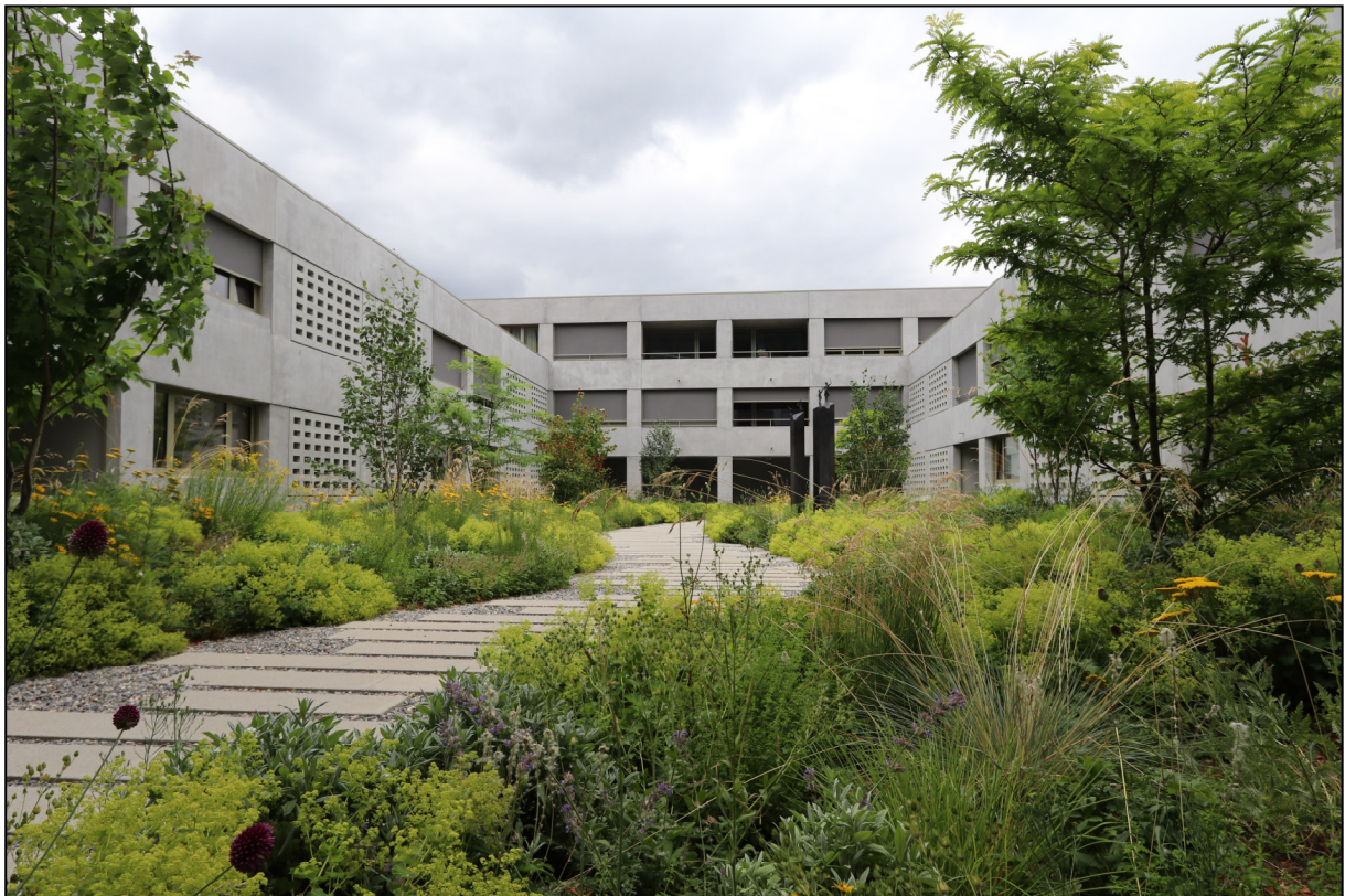
Neubauprojekt «ARCA», Balgach